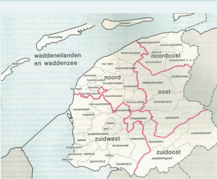
De regio 'zuidoost' in het Streekplan van 1982

Ook in de planologie zie je mijn genese uit vijf gemeenten als een proces dat in stapjes verloopt. Mijn naam keerde terug in het Streekplan van 1982, een doorwrocht document waar ambtenaren jarenlang aan gewerkt hebben. De gemeenten Smallingerland en Opsterland worden echter bij een andere regio ingedeeld, namelijk 'oost'. De planologen bleven met mijn gemeenten schuiven, want in 1989 ben ik weer verdwenen als zelfstandige entiteit in het Streekplan.