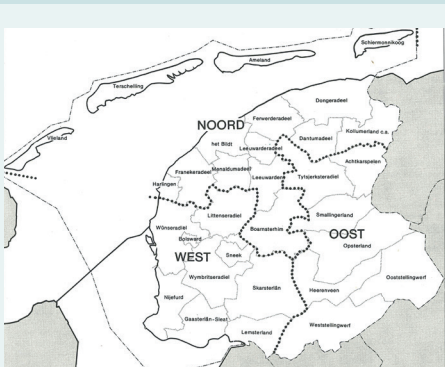
De regio 'oost' in het Streekplan van 1989