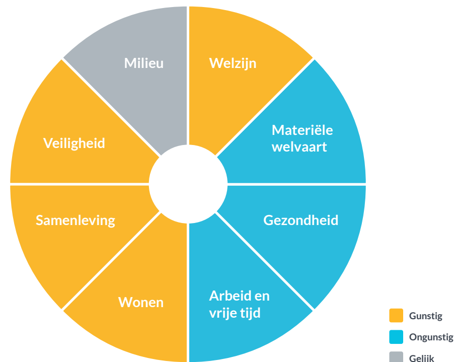
Brede welvaart Noordwest Fryslân vergeleken met Nederland

Het algemeen beeld van brede welvaart in Noordwest Fryslân is dat het relatief goed gaat op sociale aspecten, zoals welzijn, tevredenheid met het leven, woontevredenheid, sociale samenhang en veiligheid. Op deze aspecten scoort de regio gunstiger dan het landelijk gemiddelde. Op de meer economische aspecten zoals inkomen, opleidingsniveau en het bruto binnenlands product (bbp) per inwoner zijn de uitkomsten voor de regio Noordwest Fryslân lager dan landelijk. In eerder FSP-onderzoek is hetzelfde geconcludeerd voor de provincie Fryslân. Dit is bekend geworden als de 'Friese paradox'.